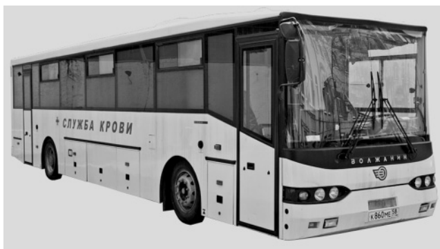
Рис. 2. Мобильный комплекс забора и заготовки крови

Формируемые портфели инновационных проектов применяются в качестве основы для будущих научно-исследовательских и опытно-конструкторских работ, создания научно-технического задела. Все проекты – и предприятий Концерна, и сторонних заявителей, подвергаются принятой процедуре отбора, подлежат обязательной экспертизе, учитываются и сопровождаются вплоть до момента их передачи в проектный офис интегрированной структуры.