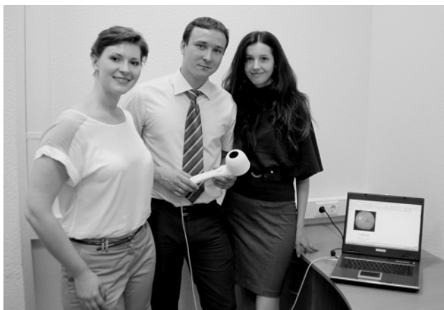
Рис. 3. Портативный автоматизированный медицинский прибор «Сферопериметр»

«Положение об отборе инновационных проектов ОАО «Концерн «Вега» содержит процедуры по организации, отбору инновационных проектов, критериям и способам их финансирования, условиям участия в них предприятий, а также методы управления проектами на всем протяжении их жизненного цикла. Существенным решением вопросов экспертизы и отбора проектов стало формирование экспертного сообщества, в котором задействованы как профильные специалисты Концерна, так и внешних организаций.